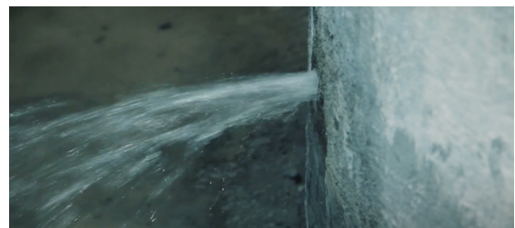
การไหลรั่วซึมของน้ำออกจาก โครงสร้างคอนกรีตบรรจุน้ำ