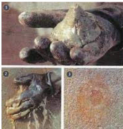
ลักษณะเนื้อผิวสัมผัสของ PENEPLUG® ภายหลังจากการผสมน้ำ